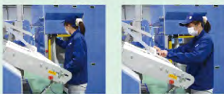
① タオルを取る ② タオルを流す

「QPT」の品物出し口へ手をかざすまでは、タオルをストックする仕組みになっているので、作業者のペースで利用することができます。