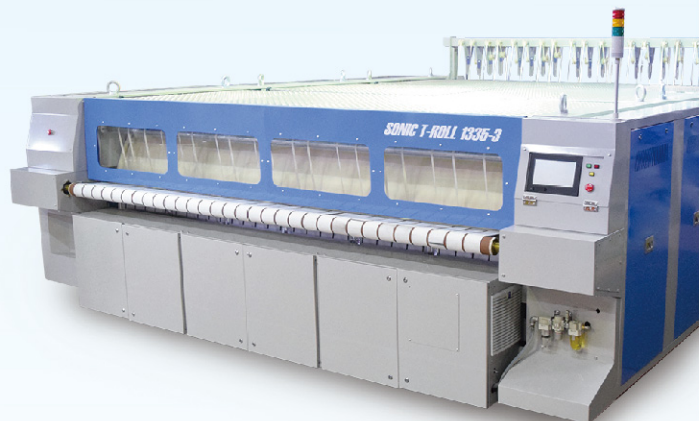
スチーム加熱式アイロナー