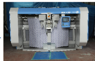
品物を拡げてフォルダーへ