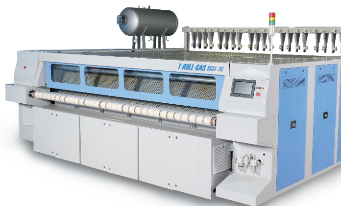
ガス加熱式アイロナー