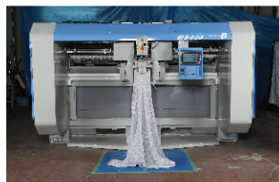
品物をコンベアに直接投入

大判ブランケット対応のたたみ機が登場しました。他にも乾燥した品物を投入してたたむことが可能です。ブランケットの特長である、厚めの生地に対応するため、折込部分の隙間を厚物に合わせてカスタマイズすることで、キレイな仕上がりを実現しました。ローポジションスタッカーも付属していますので、積載も可能となっています。